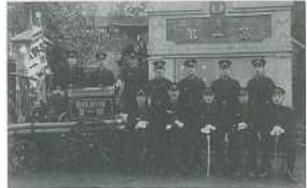
明治28年頃の吾野消防組手元には指揮刀