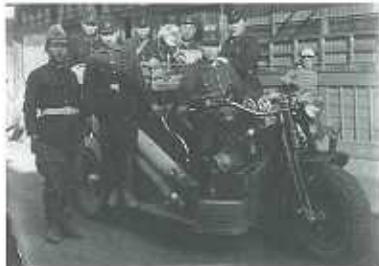
昭和14年頃、はじめてのドイツ製オート三輪車の消防車。就寝時には枕元に制服を置き、非常時に備えた。