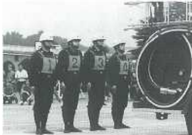
作業服としての1代目