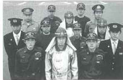
現在は季節、用途によって制服・作業着もいろいろ。作業着は2代目