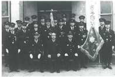
昭和37年頃制服は1着のみ