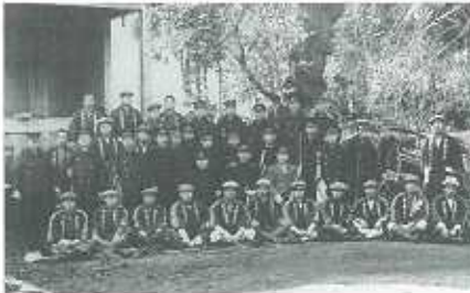
明治28年に消防組として大きな貢献をしていた頃