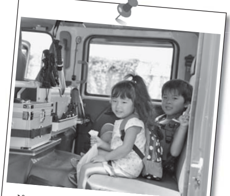
ポンプ車に乗れてニコニコ笑顔