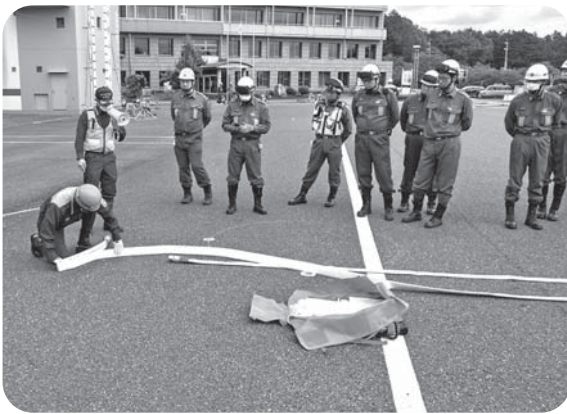
『ホースバッグ (ホース展張収納)』

昨年より順次各分団へ配備が進められている。火災現場の最前線で使用されるノズル。従来の管鎗に比べ、全長が短く狭い場所でも取り回しが良く、現場の状況に適時、的確に対応することが可能