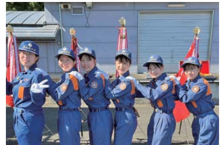
ママ会社員も大学生も消防団員