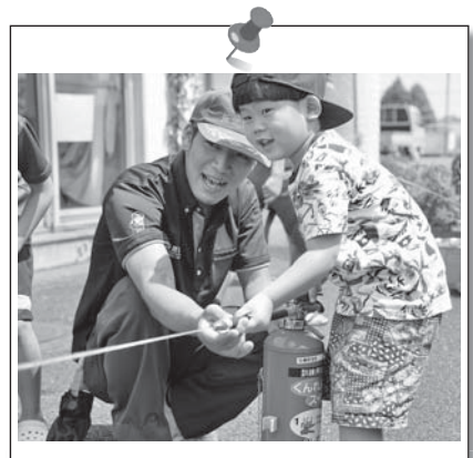
ドキドキ水消火器体験