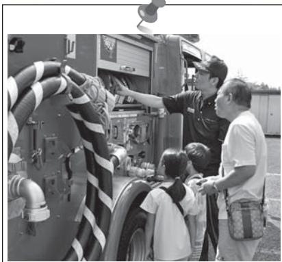
ポンプ車の説明にも力が入る