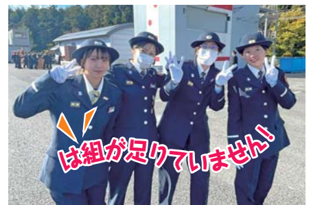
あなたの力で飯能市の防災を