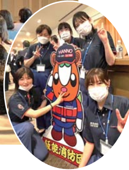
むーま 新活動服の夢馬と

毎年第2ブロックの女性団員が集まり活動発表や情報交換をします。今年は担当が埼玉西部支部です。約1年前から準備をしてきました。活動発表では“TV番組の公開生放送”という設定で、飯能市の魅力や女性団員の活動紹介をしました。