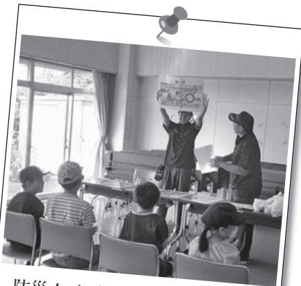
防災クイズ 目指せ全問正解!!

第7分団では、令和5年2月26日(第7分団2部詰所)、7月29日(浅間盆踊り会場)、8月20日(精明地区行政センター)に消防体験会を三回開催しました。 内容は、防災クイズ、消防車両展示、水消火器体験、子ども防火服貸し出しなどを行いました。 この体験会を通して、地域の大人や子どもたちに防災や消防団活動に楽しく興味を持ってもらうことができました。 そして、体験会に来ていただいた沢山の皆さま、ご参加ありがとうございました。団員の消防団活動の励みとなりました。今後も第7分団としては定期的に消防体験会を行っていく予定です。ぜひとも今後の体験会にご家族お誘いあわせのうえ、ご参加していただけることをお待ちしております。