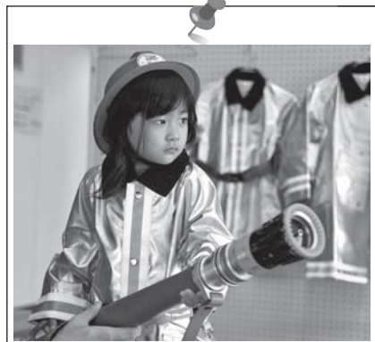
防火服着装「火点は前方の標的!!」