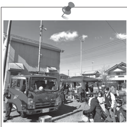
沢山の皆さまにご来場いただきました