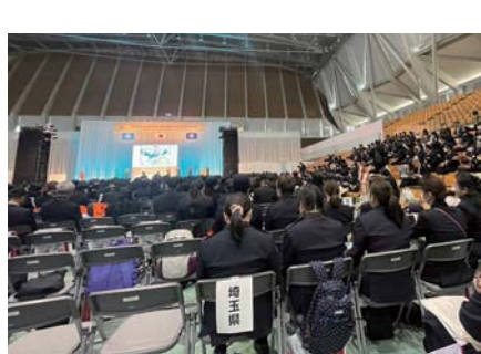
全国女性消防団員活性化石川大会